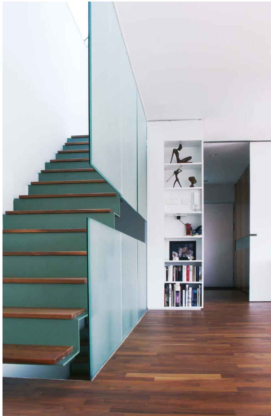
U04 / WOHNHAUS

KONZEPTION UND BAUAUS- FÜHRUNG FÜR EINE VILLA IN STUTT GART